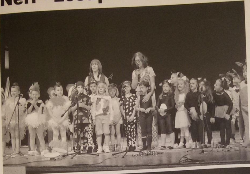
"IL MONDO CHE VORREI" E "I MUSICANTI DI BREMA"

Per due giorni - il 10 e l'11 giugno - nel teatro Rossini il brio di centinaia di bambini, la curiosità delle loro famiglie e la dedizione delle docenti hanno dato vita al momento più atteso dell'anno: quello in cui mostrare il proprio talento corale e recitativo.