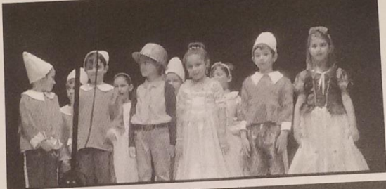
"FEDRO: LA VOLPE E LA CICOGNA" E "PETER PAN MUSICAL"